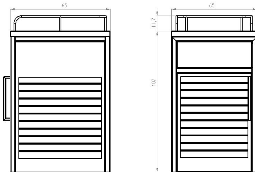
wymiary podano w [cm]